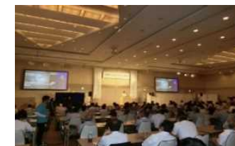
「宇宙シンポジウムin串本」 (令和3年7月開催)