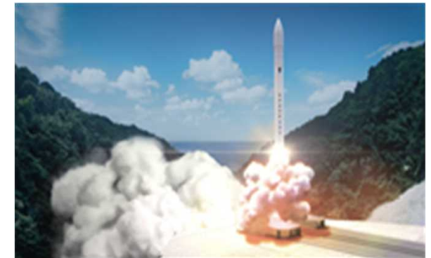
ロケット [KAIROS] 打上げイメージ