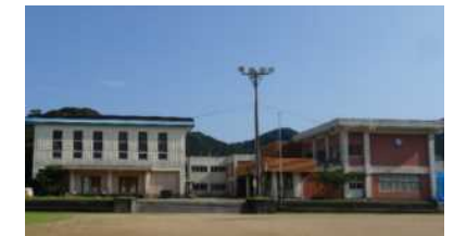
公式見学場 (那智勝浦町: 旧浦神小学校)