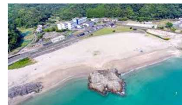
公式見学場 (串本町: 田原海水浴場)